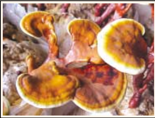
परिपक्व रिशी के स्पोर्स

पहले फ्लश लेने के बाद पुनः शुरू की स्थितियां दोहराते हैं: यानि तापमान 30°C और आर्द्रता 90 प्रतिशत से ऊपर, ताजी हवा एवं प्रकाश ताकि रिशी का दूसरा दौर (फ्लश) शुरू हो। पिनिंग के बाद उपरोक्त क्रियाओं का चक्र हू-ब-हू पूरा करना होता है। इस तरह रिशी की तीन फ्लश ली जा सकती है। तीनों फ्लशों को मिलाकर रिशी 15 से 25 प्रतिशत BE देता है: यानि एक किलो सूखे माध्यम से 150 से 250 ग्राम रिशी निकलता है।